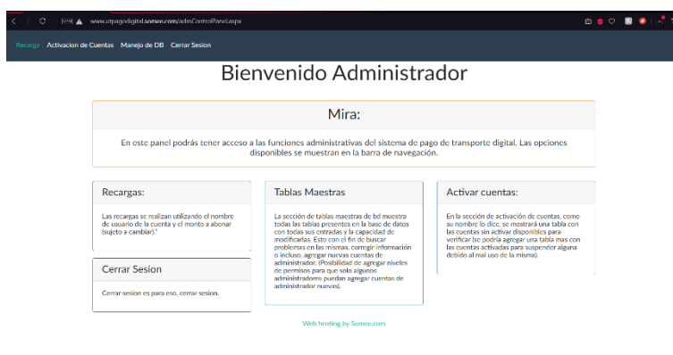
Figura 6. Panel de Administración

Por último, en el acceso al público en general no se requiere de una autenticación, ya que en este perfil únicamente se puede visualizar el sitio principal en donde se dan a conocer los detalles del proyecto, el por qué nace, quien lo dirigió y los colaboradores del mismo, con la finalidad de que las personas que visiten la página puedan conocer el objetivo del proyecto y contribuyan a su posicionamiento y difusión en la sociedad. Lo anterior se detalla en la siguiente figura: