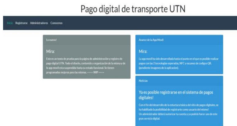
Figura 9. Inicio de página Pago digital de transporte de la UTN.